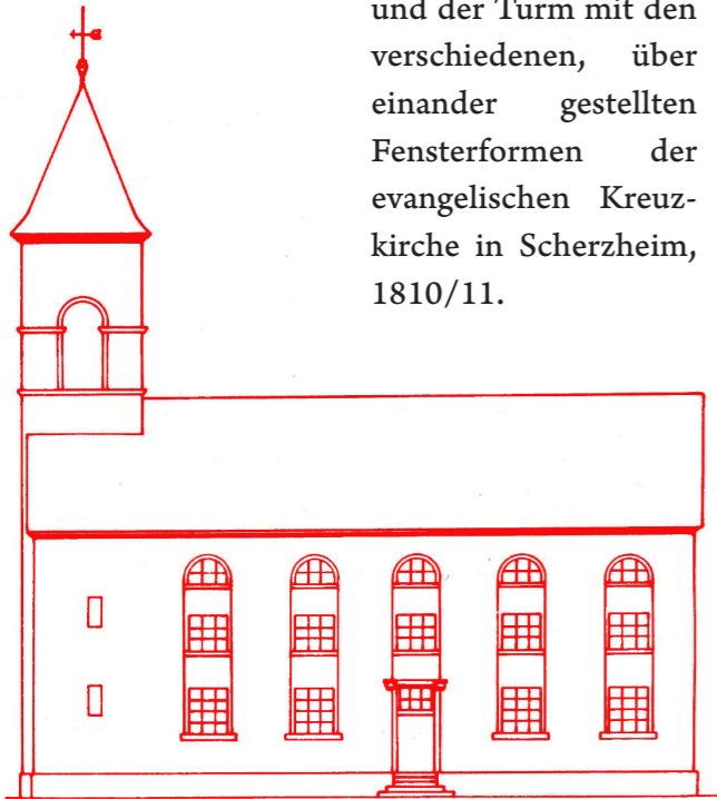
Bild nach: Hans Huth, Die Kunstdenkmäler des Landkreises Mannheim , 1987

und der Turm mit den verschiedenen, über einander gestellten Fensterformen der evangelischen Kreuzkirche in Scherzheim, 1810/11.